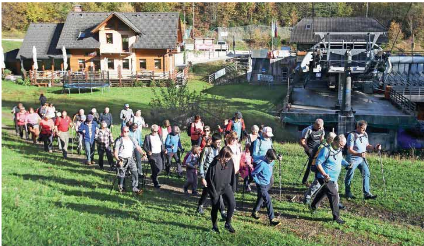
Valentinovega pohoda se je udeležilo 44 pohodnikov, od tega osem otrok.