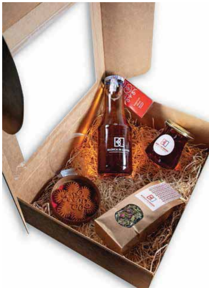
Zeliščno-medeni paket

Ponudbo prehranskih izdelkov, moke in drugih mlevskih izdelkov, olj, zeliščnih izdelkov, izdelkov za nego telesa ter izdelkov domače in umetnostne obrti omenjene blagovne znamke ustvarja 41 ponudnikov na Škofjeloškem s skupno več kot 490 izdelki, med njimi je največ dopolnilnih dejavnosti na kmetijah in nosilcev osebnega dopolnilnega dela, nekaj je tudi s.p.-jev in d.o.o.-jev. Nekaj teh izdelkov v novi celostni podobi predstavljamo tudi v darilnih paketih.