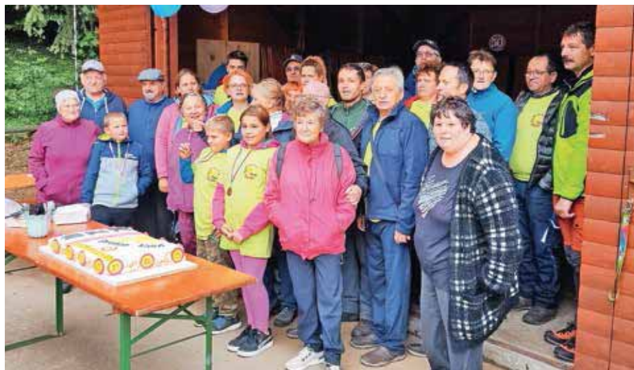
Člani Kluba zdravljenih alkoholikov Škofja Loka na Ermanovcu

V sklopu aktivnosti in v programu terapevtsko-rehabilitacijskih dejavnosti kluba so tudi pohodi. Tako so se sredi 90. let prejšnjega stoletja takratni člani odločili, da organizirajo srečanje gorenjskih klubov zdravljenih alkoholikov pri koči na Blegošu. Po nekaj poskusih ta ideja žal ni zaživela. Pojavil se je predlog, da se srečanje priredi na Ermanovcu. V letu 1997 so to tudi izvedli, kar je bil zadetek v polno. Od takrat naprej vsako leto neprekinjeno potekajo srečanja na tej lokaciji, ki je tudi primernejša. Letos, ko naš klub praznuje petdeset let delovanja, smo tudi 25. srečanju gorenjskih klubov na Ermanovcu