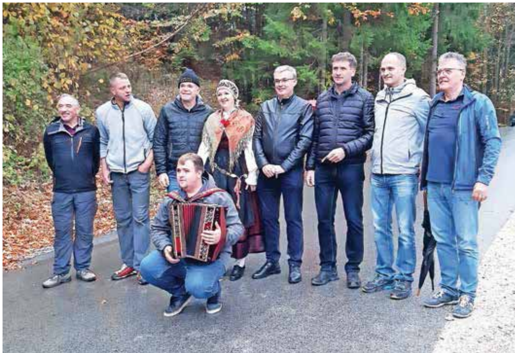
Obnovljena cesta Murave–Žetina je v kraje pod Blegošem prinesla veliko veselja.

Dela prve faze na cesti od Murav do Hleviš v dolžini 1,2 kilometra so se začela jeseni 2019 in bila v celoti zaključena leto kasneje. Sanacija v začetni gradbeni fazi je obsegala utrditev temeljnih tal ceste na štirih plazovih in dveh usadih, ki so se izvedli z različnimi geološko-geotehničnimi ukrepi za stabilizacijo terena. Na plazovih 2, 3 in 4 je bila izdelana kamnita zložba s kamnom, vložnim v beton, ki je temeljena na armiranem betonskem temelju s 6 metrov dolgimi jeklenimi piloti. Izvedene so bile drenaže brežin in plazovitih območij. Na saniranih temeljnih tleh ceste je bil zamenjan še spodnji cestni ustroj v debelini 70 centimetrov ter urejeno odvodnjavanje ceste in položen nov asfalt. Vrednost del z vključeno temeljito