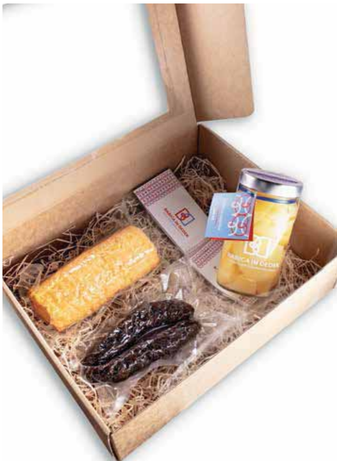
Paket domača malica

Zeliščno-medeni paket (med, dražgoški kruhek, koprivov sirup, čaj) Več informacij o ponudbi blagovne znamke, ponudnikih in možnostih naročanja darilnih paketov: Razvojna agencija Sora, Poljanska cesta 2, 4220 Škofja Loka, tel. št. 04/ 50 60 225, e-naslov: kristina.miklavcic@ra-sora.si in spletna stran http://babicadedek.si/ .