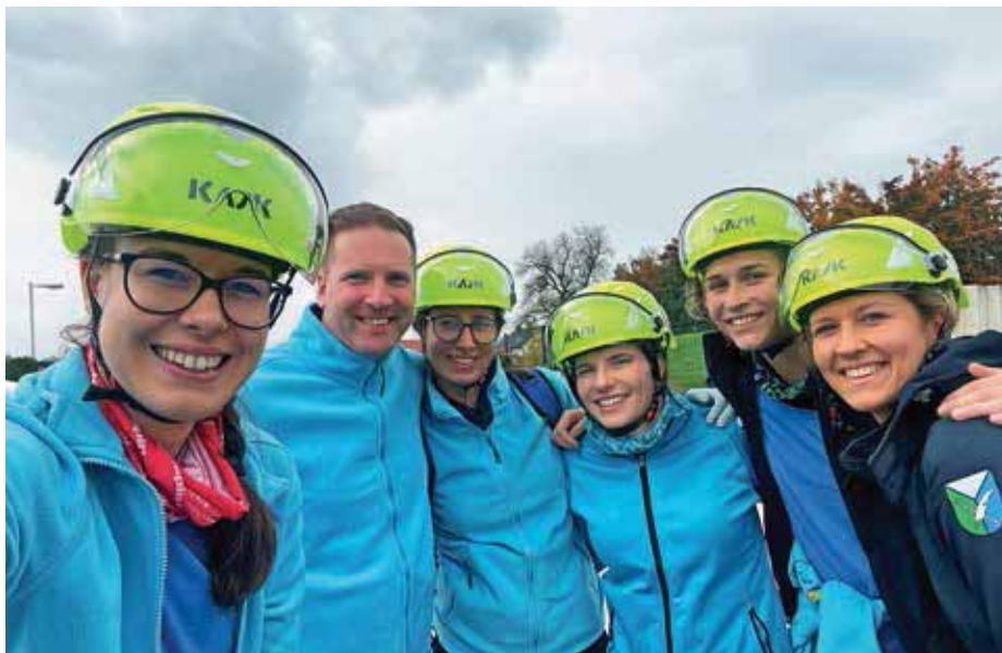
Ekipa prve pomoči iz občine Gorenja vas - Poljane

Letošnje preverjanje ekip torej ni potekalo v tekmovalnem duhu (rezultati niso bili pomembni, saj je letošnje državno tekmovanje odpadlo), zato so bili vsi zmagovalci. Letošnje preverjanje je bilo tako usmerjeno v izpopolnitev znanja in vseh postopkov, ki jih je bilo treba izvesti pri ponesrečencih.