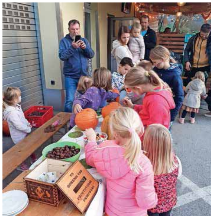
Noč čarovnic v Gorenji vasi

pomočjo Zavoda Poljanska dolina je bila po njegovih ugotovitvah očitno uspešna. Obiskovalci z otroci so prišli s širšega škofjeloškega območja. Oglasili sta se tudi madžarska in nemška družina, ki sta bili nastanjeni pri ponudnikih na tem območju. V društvu že napovedujejo nov dogodek, to bo prižig lučk na trgu Ivana Regna v Gorenji vasi 3. decembra ob 17. uri.