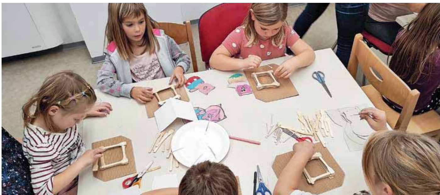
Utrinki s prve ustvarjalne delavnice v oktobru.

Knjižnice svojim članom omogočamo tudi dostop do informacij v različnih domačih in tujih podatkovnih zbirkah. Dostop do nekaterih podatkovnih zbirk omogočamo z zakupom dostopa. Od pogodbenih določil je odvisno, ali posamezna knjižnica članom omogoča oddaljen dostop (od doma, iz šole ...) s pomočjo gesla ali pa le dostop iz prostorov knjižnice. Nekatere podatkovne zbirke kreiramo knjižničarji sami, dostop do teh je brezplačen in prost za vse, tudi za nečlane. Knjižničarji pa priporočamo tudi nekatere podatkovne zbirke, ki so prosto dostopne na spletu.