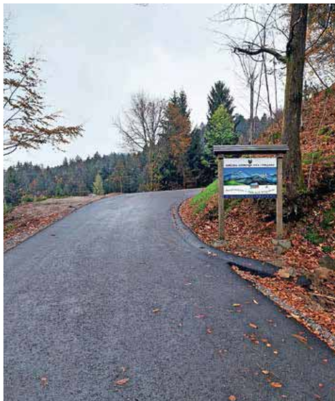
Obnovili so 600 metrov dolg odsek na lokalni cesti Lenart–Zapreval.

»Na tem odseku ceste smo dve serpentini razširili tako, da je sedaj možen prevoz avtobusa tudi s te strani.« Asfaltiranje je bilo zaključeno konec oktobra. Kot pojasnjuje Boštjan Kočar, svetovalec za komunalno infrastrukturo, končni obračun še ni bil izveden. Po ponudbi pa vrednost gradbenih del znaša 210 tisoč evrov z vključenih davkom. Sanacijo v celoti krije občina. Izvajalec gradbenih del Hip KA, ki je bil izbran na javnem razpisu kot najugodnejši ponudnik, mora še urediti del brežin in nasuti bankine. S tem bo sanacija zaključena še v tem mesecu.