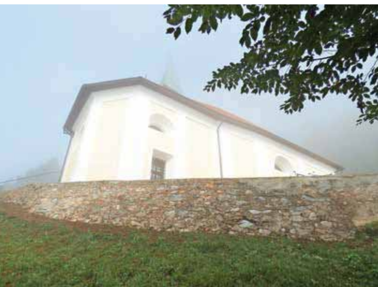
Obzidje, obnovljeno po strokovnih navodilih, je najnovejša pridobitev čabraške cerkve.

Restavriran je bil na pobudo domačina, izvajalca beljenja, ki je ta poseg tudi financiral. S podporo posameznih botrov je bil obnovljen križev pot, tako okvirji, ki izvirajo iz župnijske cerkve na Trati, kot slike na platnu. Te je v prvi polovici 19. stoletja izdelal podobar Luka Čeferin, bližnji leskoviški rojak. Slike so bile prvotno v župnijski cerkvi sv. Urha v Leskovici. Obnovljeno je bilo leseno stopnišče v zvoniku in streha na zakristiji. Po cerkvi je bil položen tlak iz hotavelskega kamna, ki ga je doniralo podjetje Marmor Hotavlje, restavrirane so bile tudi originalne kamnite stopnice v prezbiteriju. Podjetje je v letu 2022 sofinanciralo tudi strokovno sanacijo kamnitega obzidja okrog cerkve. Dela so bila izvedena po konservatorskih smernicah Zavoda za varstvo kulturne dediščine, enota Ljubljana. Obnova obzidja je vzor podobnim obnovam v okolici, saj je bila ohranjena prvotna kamnita struktura zidave iz lokalnega kamna. S sofinanciranjem je obnova cerkve in obzidja podprla tudi Občina Gorenja vas - Poljane, glavnino del pa so s prostovoljnimi delom in darovi podprli domači verniki in krajanji.