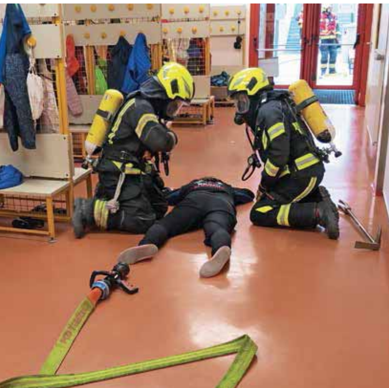
Reševanje ponesrečenca na vaji evakuacije