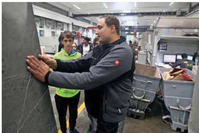
V podjetju Marmor Hotavlje so v oktobru odprli vrata učencem in dijakom.