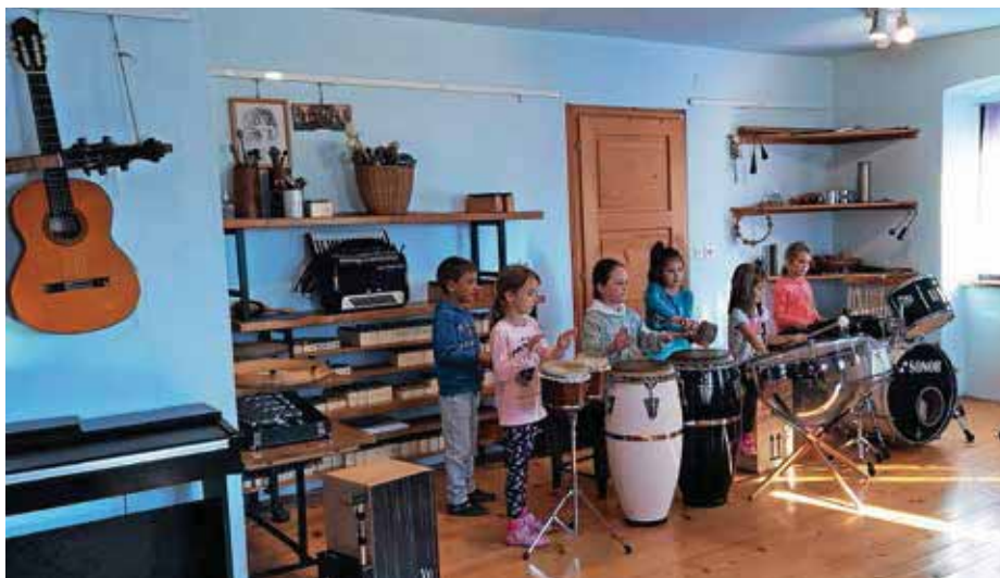
Prvošolski orkester

Najbolj glasbeno obarvan pa je bil kulturni dan Svet glasbil. Začel se je s kvizom o glasbilih, kasneje je bil posebne pozornosti deležen koncertni bonton. Učenci so se v skupinah pogovarjali o obnašanju na koncertu, nastale so tudi risbe, stripi in plakati na to temo. Vrhunec kulturnega dne pa se je dogajal v šolski telovadnici, ki je dovolj prostorna, da vsi učenci lahko spremljajo koncert. Že prva točka koncerta je poskrbela, da smo se začeli