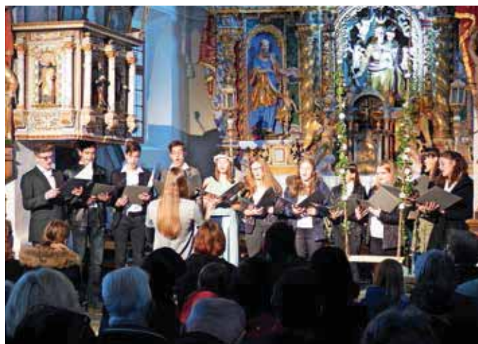
V cerkvi na Gori so odmevale Marijine pesmi.