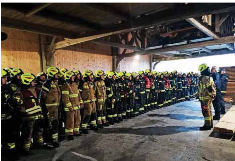
Postroj gasilcev pred županom v Zadobju