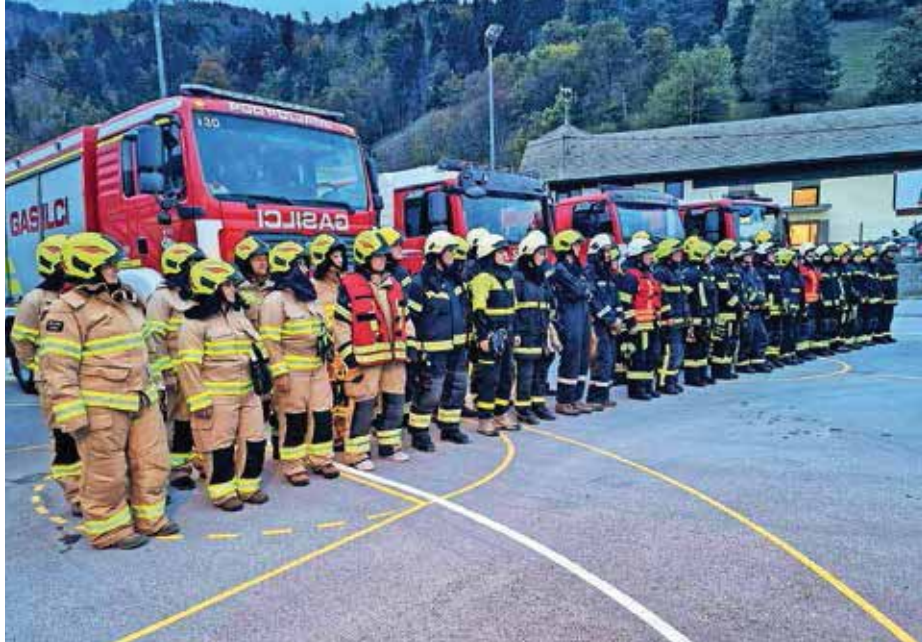
Postroj gasilk pred županom na Trebiji

načrtovanih in tudi izvedenih vaj. »Upam in želim si, da se naslednje leto ponovno srečamo v popolni sestavi – torej v prisotnosti vseh društev v občini.« Dan kasneje je v Zadobju potekala še občinska vaja članov. Gasilci, približno 120 se jih je zbralo, so gasili požar, ki je zaradi udara strele prizadel gospodarsko poslopje žage Premetovc, kjer se opravlja gospodarska dejavnost. Na prizorišču