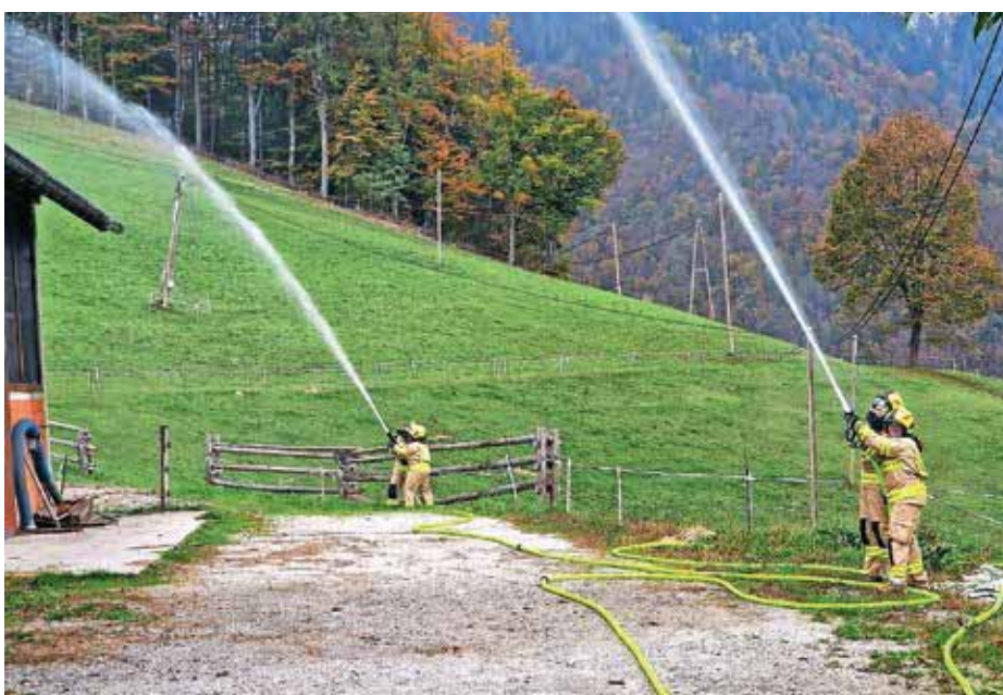
Gasilke ob gašenju požara na gospodarskem objektu Pr Burnk v Stari Oselici