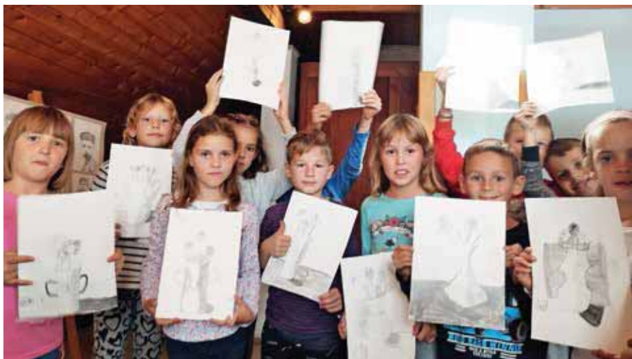
Risarji drugega razreda