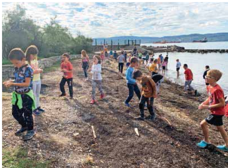
Učenci 2. razreda na Debelem rtiču

Učenci so se povzpeli na bližnje hribe (na Sveti Urban, Gorenje Brdo, Javorč, Vinharje, Grmado), devetošolci pa so na Golem vrhu spoznavali Rupnikovo linijo. Zanimiv kulturni dan je bil za učence 5. razreda. V Slovenskem šolskem muzeju v Ljubljani so doživeli pravo učno uro na stari način, vadili lepopsis in si ogledali prenovljene in sodobno oblikovane muzejske zbirke. Učenci 6. in 7. razreda so na tehniškem dnevu izdelovali vetrnice, vzvod in škripec, se učili o izdelovanju strojev in mehanizmov, sestavili so celo robotsko roko. V istem tednu so sedmošolci imeli še modeliranje z računalnikom in modeliranje izdelkov iz papirnih gradiv ter predavanje o varni rabi interneta.