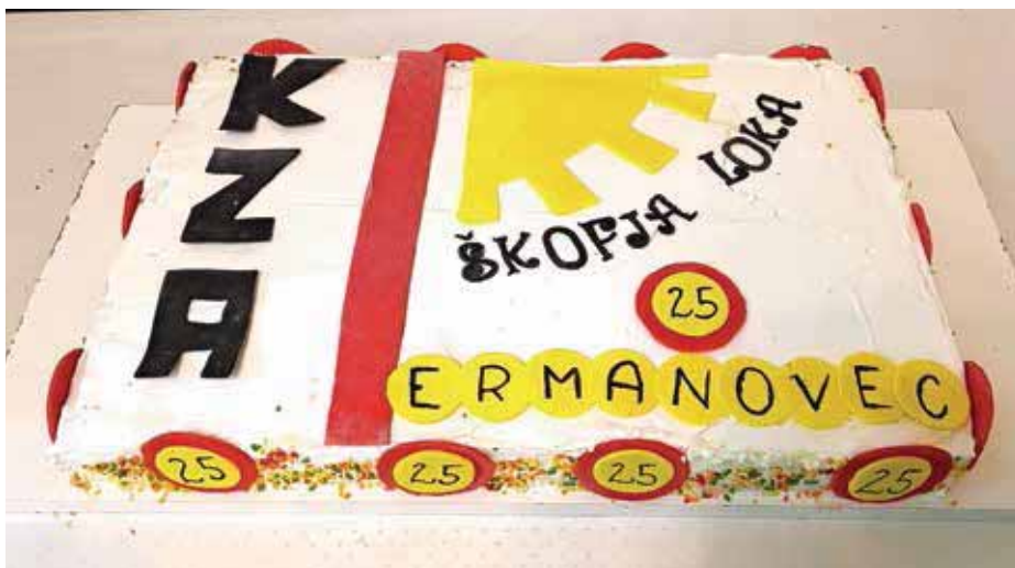
Članica Sara je za praznovanje jubileja spekla posebno torto z napisom in znakom kluba.

Zadovoljni z druženjem, izmenjavo izkušenj in predlogov za nadaljnje sodelovanje smo se v popoldanskih urah razšli z željo, da se naslednje leto zopet srečamo.