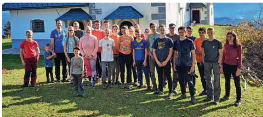
Okoli cerkve na Malenskem vrhu so izvedli čiščenje grmovja in odstranjevanje drevja.