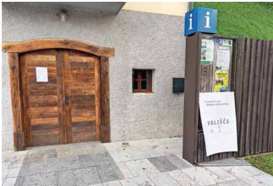
Volišče v Poljanah so iz kulturnega doma prestavili v Šubičevo hišo.

V osnovni šoli Javorje bodo svoj glas lahko oddali prebivalci Četene Ravni, Dolenčič, Dolenje Žetine, Gorenje Ravni (hišni številki 6 in 8), Gorenje Žetine, Jarčjega Brda, Javorij, Krivega Brda, Mlake nad