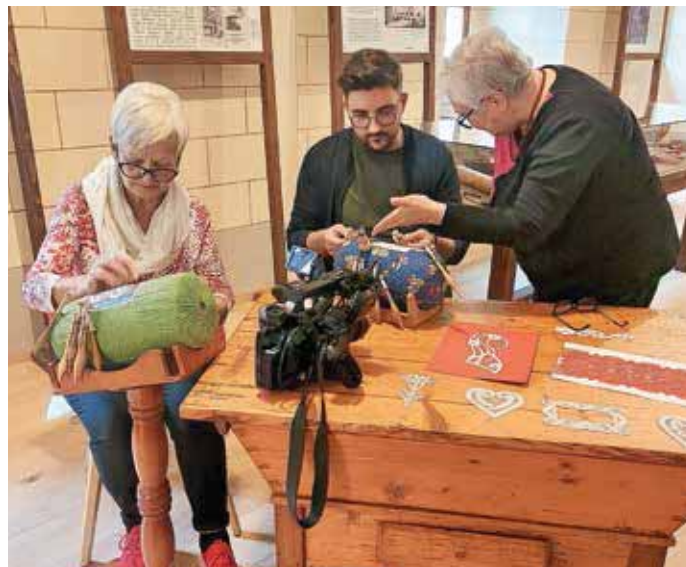
Planet TV na obisku

Sredi oktobra je Dvorec Visoko obiskala ekipa oddaje Dobro jutro z RTV Slovenija, kjer je tematika temeljila na kulinariki Visokega na osnovi knjige Pavleta Hafnerja Ta dobra stara kuha, ekipa pa si je privoščila še terjak, skuhan v visoški kuhinji. Teden zatem nas je obiskala še ekipa Planet TV iz oddaje Jutro na Planetu, s katero smo za gledalce pripravili tri krajše prispevke – o drobnjakovih štrukljih, klekljanju in meteoritu v Javorjah. Poljanska dolina pa je kot slikovit kraj s prelepo naravo tudi odlična destinacija za poroke. Dvorec Visoko je že 10 let lokacija, za katero se pari odločajo predvsem zaradi idiličnega naravnega okolja, v zadnjem času pa tudi zaradi trenda porok v naravi in pod kozolci. Tako zaradi predstavitve lokacije potencialnim parom kot zaradi sledenja trendom na področju izvedbe poročnega protokola smo se kot razstavljaenci udeležili Slovenskega poročnega sejma Brdo. Odziv parov na našo predstavitev je bil izjemo pozitiven in verjamemo, da bo marsikateri par usodni da dahnil prav tu.