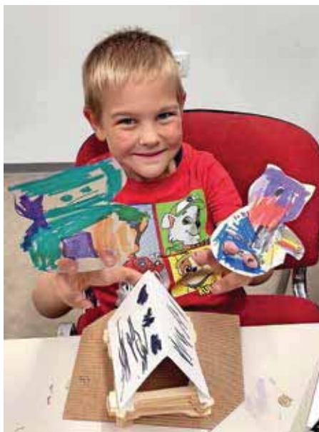
Izdelovali smo hiško in pujske po pravljici Trije prašički .